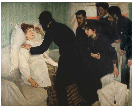
Bild: Richard Bergh, Hypnotisk seans, 1887. Nationalmuseum, NM 1851