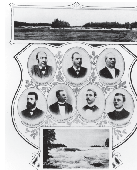
I början av 1890-talet låg Hissmofors ännu stämjäl och vild i en nästan orörd natur där endast övalkvarnens gård och stampande släcke fiden. De sju herrarna äro bolagets stiftare.