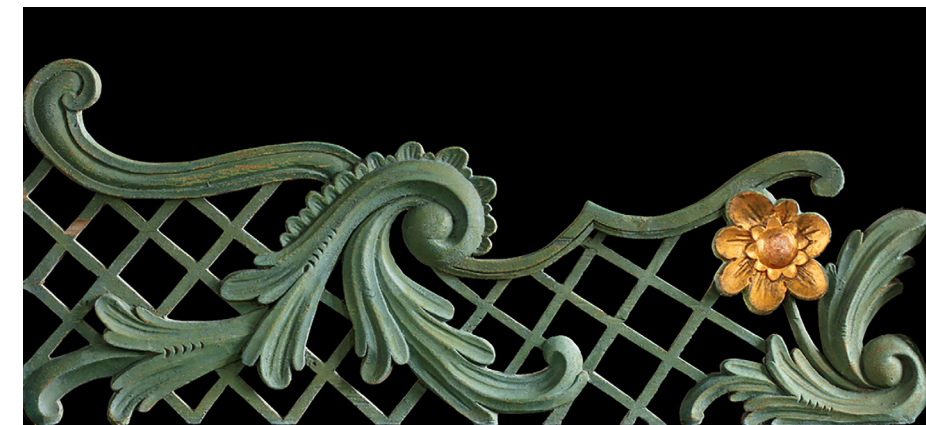
Del av korskranket i Storsjö kyrka utfört av Jöns Ljungberg.

Arrangör: Arkivet i Östersund i samarbete med Jamtli Tid: Torsdagar klockan 13.00