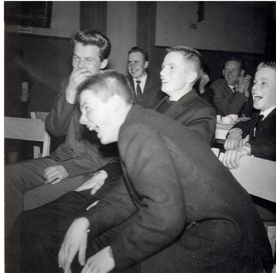
Logen nr 311 Sunne av IOGT-NTO.

På den lokala nivån hittar man Grundlogerna eller bara kort och gott Logerna. Arkivmaterialet från logerna kan ofta berätta spännande saker om livet förr och fritidsaktiviteter i en viss by.