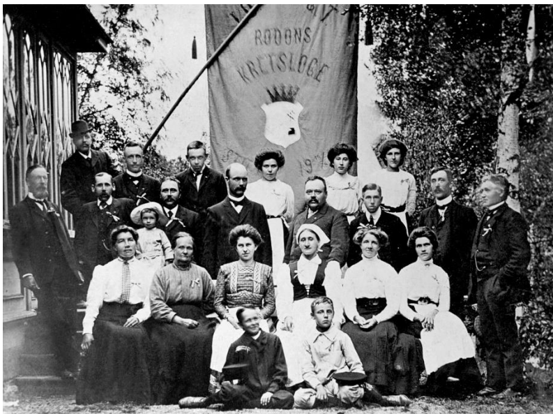
Rödöns kretsloge av IOGT.

Under storlogen finns distriktsloger. I Jämtland har det funnits ett antal sådana, som så småningom slagits ihop till Jämtlands läns distriktsloge av IOGT. Till distriktet skickade de lokala logerna in mycket statistik och verksamhetsbeskrivningar. Om du inte hittar en lokal loge kan du istället hitta lokalt material i distriktslogen.