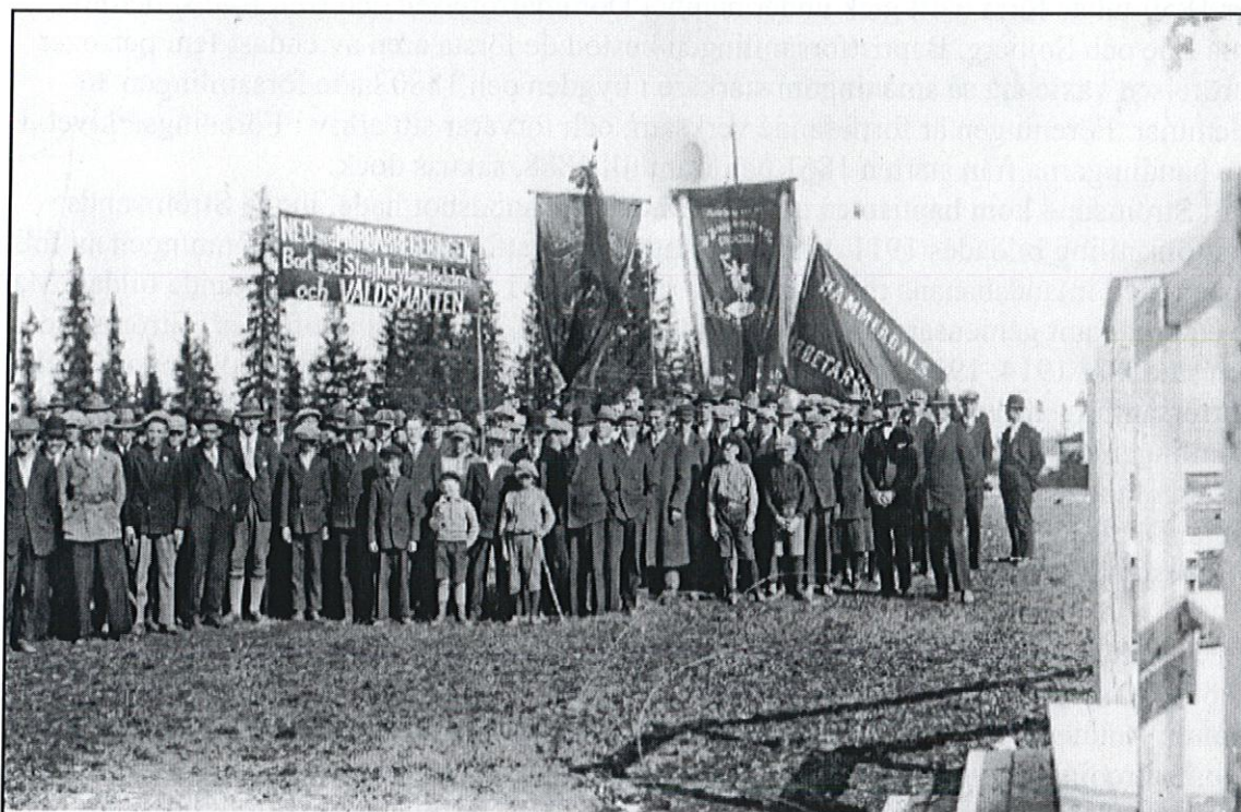
Hammerdals Arbetarekommun demonstrerar 1931.

Bondeförbundet hade i början av 1920-talet sina flesta anhängare i Hammerdalsområdet. Hammerdals sockenförening av Bondeförbundet bildades 1920. Framgångarna för Bondeförbundet i Sverige under 1930-talet ledde till att intresset för bildandet av avdelningar ute i landet ökade. Ströms avdelning av Bondeförbundet bildades 1936. Jordbruks- och vägfrågor i glesbygden var de frågor som ägnades störst intresse i föreningen. Strömsund hade även under senare delen av 1930- och 1940-talet en mycket aktiv SLU-avdelning. Föreningen bedrev omfattande studiecirkelverksamhet och anordnade bl.a tävlingar i köksväxtodling för skolbarn, enligt föreningens historik, de första inom SLU i Sverige. Föreningen tog 1941 initiativ till inlämnandet av en motion till SLU-distriktet, som föreslog en uppvaktning hos landshövdingen angående inrättande av en lantushållsskola vid Birka i Ås. Motionärerna påpekade behovet hos den kvinnliga jordbrukarungdomen i länet att, i likhet med den manliga, få en kvalificerad undervisning inom sitt speciella arbetsområde. Motionen bifölls och några år efter uppvaktningen, 1945, togs Rösta lantushållsskola i Ås i bruk.