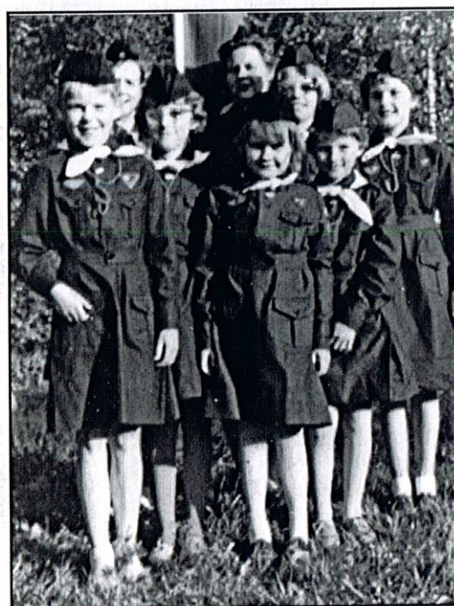
Blåvingar i Strömsunds scoutkår ca 1960.

Av de äldre folkrörelserna, mer ideologiskt baserade, finns idag inte många verksamma. Dagens föreningsliv är mer intressebaserat. Exempel på detta är handikapprörelsen och pensionärsorganisationerna, vilka båda samlar relativt många människor. Med ökningen av antalet pensionärer ökar följaktligen även behovet av organisationer som kan fungera som påverknings- och kontaktorgan och ta tillvara medlemmarnas intressen gentemot tex stat och kommun. I Strömsunds kommuns inventering är handikapp- och pensionärsföreningarna registrerade under kategorin "Övriga" tillsammans med andra intressebaserade föreningar såsom byalag, ungdomsföreningar av olika slag, syföreningar m.fl. Tillsammans utgör de ungefär 9% av de registrerade föreningarna.