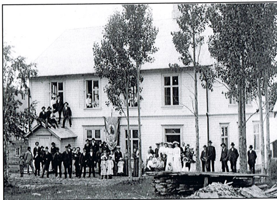
Hillsands blåbandsförening samlade utanför sitt nybyggda föreningshus.

samlade sju medlemmar. Antalet ökade dock redan under det första verksamhetsåret till 60 stycken. De flesta kom troligen från absolutistföreningen. Denna och blåbandsföreningen fungerade parallellt i några år eftersom man i största samförstånd kommit överens om att undvika att mötena hölls samtidigt. Senare höll man även en del gemensamma möten. Absolutistföreningens protokoll slutar 1901 och det mest troliga är att medlemmarna övergick till blåbandsföreningen då denna förening samma år ökade med 51 medlemmar till 171. Föreningen byggde även ett eget hus samma år, vilket invigdes sommaren 1902. Arkivhandlingar från blåbandsföreningarna i Sikås och Hillsand samt absolutistföreningen finns förvarade i Föreningsarkivet.