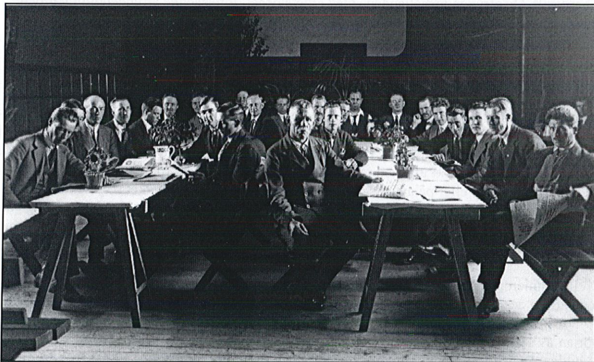
SAC:s 5-dagarskurs i f.d Upplandsbankens lokal i Strömsund 26 juli 1927.

Den syndikalistiska fackföreningsrörelsen, Sveriges Arbetares Centralorganisation, SAC , bildades 1910 av utbrytare ur LO-förbundet. SAC förordade ett decentraliserat fackligt system som grundade sig på lokala samorganisationer, LS, där alla arbetare på en ort, oavsett bransch skulle ingå. Syndikalisterna hade främst anhängare bland rallare, anläggningsarbetare och skogsarbetare. Många skogsarbetare hade säsongarbete inom skogsnäringen, de var även småbrukare och diversearbetare, och var därför i behov av ett fackligt alternativ som tillvaratog deras intressen, vilket kan ha bidragit till syndikalismens framgång. Rörelsen var väl etablerad i norra Jämtland samt i Härjedalen. Antalet föreningar var som störst under 1930-talet. I Strömsunds kommun har 32 stycken syndikalistiska föreningar registrerats. De flesta bildades under 1920-talets första år, utom föreningen i Ulriksfors som startade redan 1915. Bara inom Ströms socken har det funnits 16 syndikalistiska föreningar mellan åren 1915-1981.