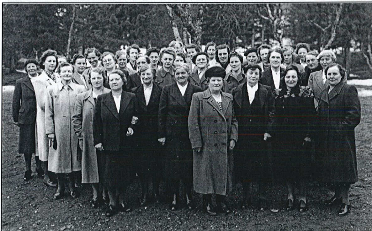
Husmodersföreningen i Handöl.

Medlemskap i husmodersföreningar och andra kvinnoföreningar var inte bara ett sätt för hemarbetande kvinnor att träffas och bryta sin eventuella isolering, utan det fungerade även som ett forum där möjligheten att föra fram sina åsikter i frågor som låg kvinnorna nära tillgodosågs. Tillsammans med andra kvinnor kände man stöd. Ofta togs initiativ till skrivelser där kvinnorna belyste problem i närmiljön om vars existens beslutsfattarna, oftast män, inte var medvetna. Handöls husmodersförening beslutade på sitt årsmöte 1962 att verka för att affärerna på orten, av hygieniska skäl, skulle förvara mjölken i glasflaskor eftersom klagomål hade framförts från allmänheten. Man kan anta att man med allmänheten menade husmödrarna själva eftersom det var dessa som skötte den största delen av inköpen. Husmödrarna representerade den största yrkesgruppen i samhället och detta borde ha bidragit till att deras åsikter i dessa frågor var viktiga. Troligt är att handlarna tog uppmaningen på allvar just av denna orsak. Ånns husmodersförening framförde 1973 klagomål till Konsum Jämtland där man påpekade svårigheten att kunna köpa färskt bröd och föreslog därför datummärkning av bröd. I svaret från Konsum Jämtland lovade man