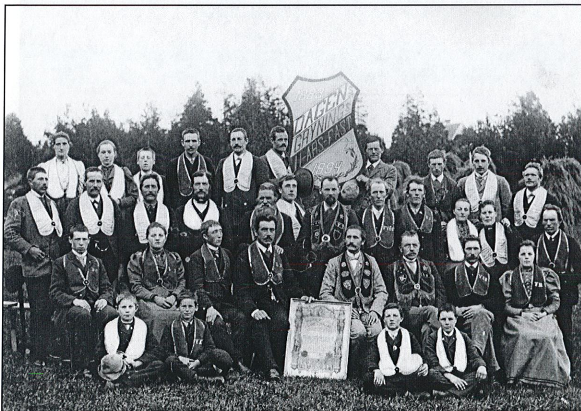
Logen nr 778 Dagens Gryning av IOGT i Ocke firar elvaårsjubileum 1894.

Nyckterhetsrörelsen hade ett starkt fäste i Jämtlands län och Åre kommun utgör inget undantag. Ett stort antal föreningar har registrerats, de flesta tillhörande IOGT som var den dominerande nyckterhetsorganisationen i länet. Mattmar och Marby tillhörde i slutet av 1800- och i början av 1900-talet de socknar där mer än var femte invånare var organiserad nykterist. I Mattmars socken har 18 föreningar med nyckterhetsanknytning registrerats, vilket motsvarar ca 16% av de i socknen registrerade föreningarna. Av dessa är sju stycken krets- och gradloger, sju ungdomsloger eller juniorföreningar och två stycken tillhör Verdandi, som var arbetarrörelsens nyckterhetsorganisation. Efter nyckterhetsrörelsens storhetstid under slutet av 1800-talet och fram till ca 1920 har medlemsantalet i nyckterhetsrörelsen gått tillbaka. I Mattmar socken är idag endast en IOGT-loge, eller lokalförening som de numera benämns, fortfarande verksam, Hoppets grund i Mattmar, bildad 1884. I kommunen i stort når andelen nyckterhetsföreningar upp till ca 9% av de registrerade föreningarna.