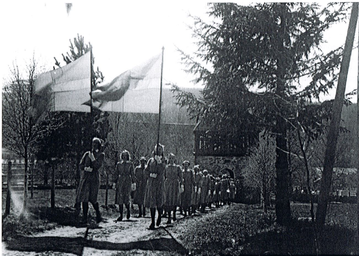
Åre lottakår på väg från Åre gamla kyrka 30 maj 1944.

Av de äldre folkrörelserna, mer ideologiskt baserade, finns idag inte många verksamma. Dagens föreningsliv är mer intressebaserat. Exempel på detta är handikapprörelsen och pensionärsorganisationerna, vilka båda samlar relativt många människor. Med ökningen av antalet pensionärer ökar följaktligen även behovet av organisationer som kan fungera som påverkning- och kontaktorgan och ta tillvara medlemmarnas intressen gentemot stat och kommun. I Åre kommuns inventering är handikapp- och pensionärsföreningarna registrerade under kategorin "Övriga" tillsammans med andra intressebaserade föreningar såsom byalag, ungdomsföreningar av olika slag, syföreningar m.fl. Tillsammans utgör de ungefär 11% av de registrerade föreningarna.