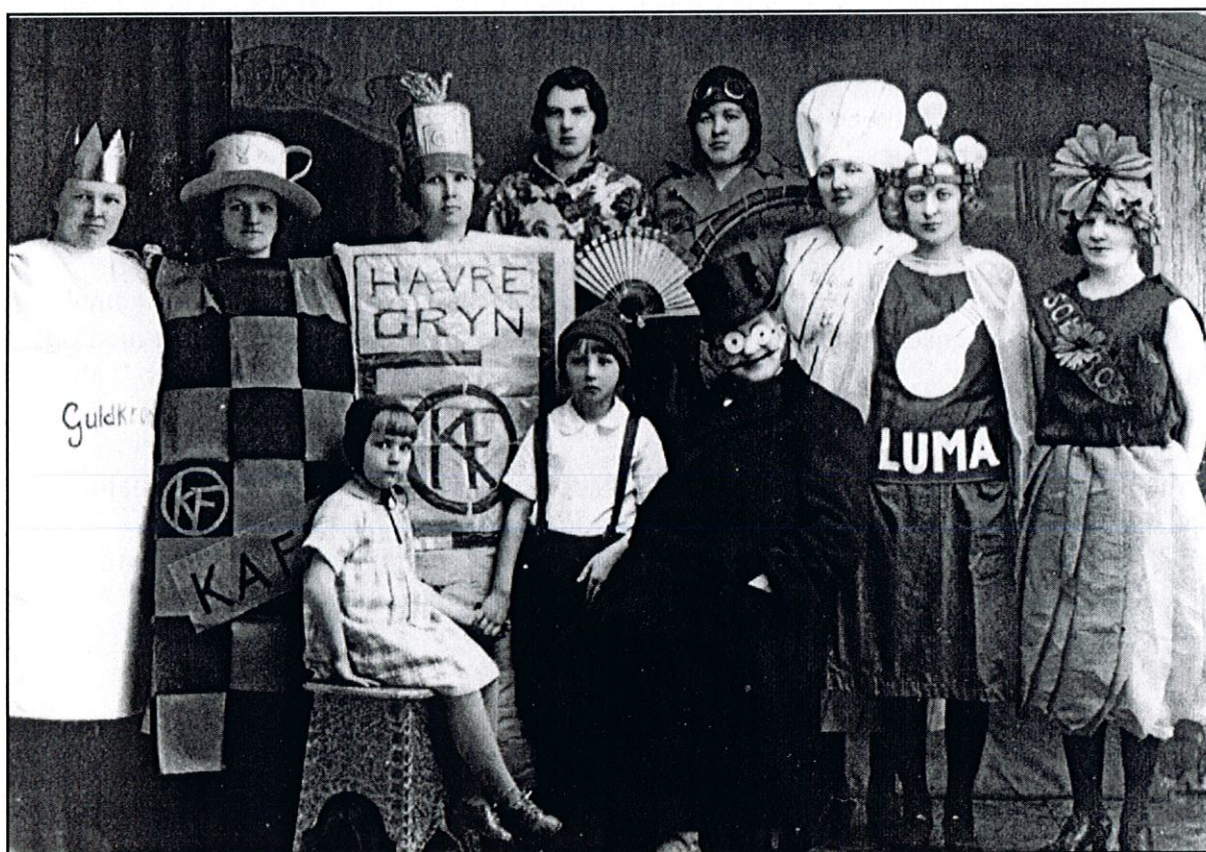
Järpens kooperativa kvinnogille gör en tablå med kooperativa produkter.

I likhet med resultatet av inventeringen av Bergs kommun uppvisar Åre kommun ett stort antal ekonomiska och kooperativa föreningar . Andelen ekonomiska föreningar ligger på 34%, vilket är ca 14% högre än Krokoms och Härjedalens och ca 4% högre än Bergs. Det jämförelsevis höga antalet registrerade föreningar av denna typ förklaras delvis genom att glesbygdssområdena i regel uppvisar en hög förekomst av ekonomiska och kooperativa föreningar. Den service som i städer och tätorter varit en kommunal angelägenhet, har på landsbygden fått ordnas av byborna själva genom bildandet av olika ekonomiska och kooperativa föreningar. Idag sköts de flesta av dessa serviceområden av stat och kommun, men det betyder inte att denna föreningstyp har försvunnit. En del gamla föreningar är fortfarande aktiva och nya har kommit till, tex ekonomiska byutvecklingföreningar, föräldrakooperativa daghem och bostadsrättsföreningar. Hallens och Åre socknar uppvisar de största andelarna ekonomiska och kooperativa föreningar av det totala antalet inventerade föreningar med vardera 37%. Dock ligger ingen av de inventerade socknarna i kommunen under 27% när det gäller denna kategori föreningar.