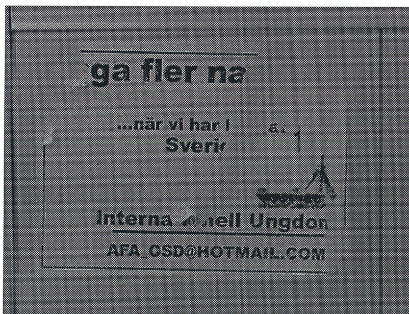
Exempel på dekal från Antifascistisk Aktion, 2002.

Exempel på nyhetsbrev från Djurens Rätt, 2002.