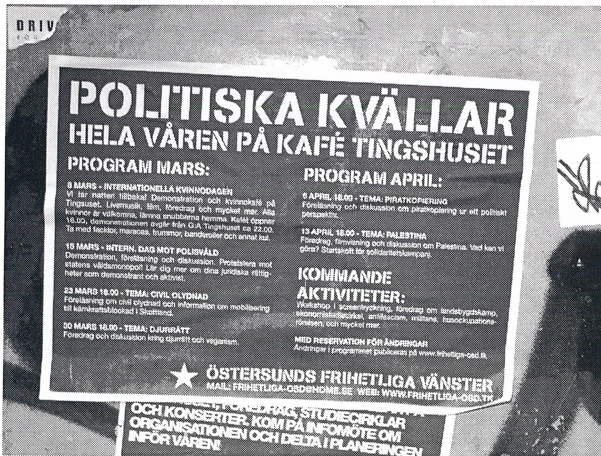
Exempel på affischer från det nybildade Östersunds frihetliga vänster, 2003.